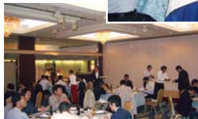
愛知の青年部会との 有意義な情報交換会