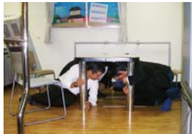
震度7クラスの 地震体験

今年東日本大震災があり、「危機管理能力の習得」をテーマに災害が起こった時に、我々物流業界がまず、何をすべきかを学びました。