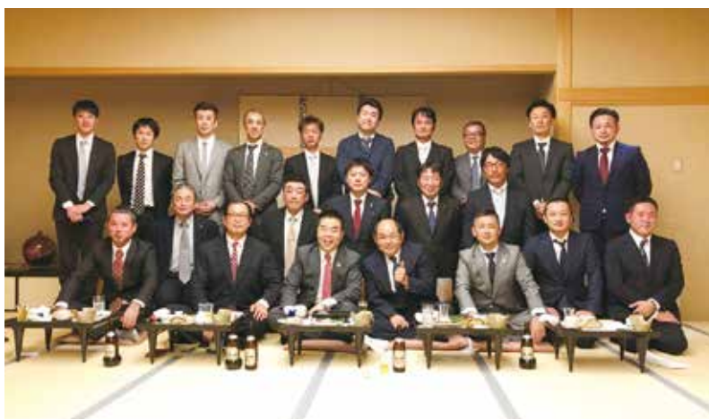
滋賀県中小企業青年中央会の皆様