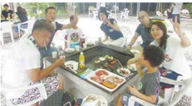
美味しいお肉を食べました。