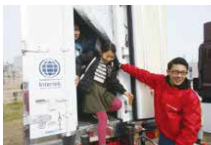
冷凍車でのヒンヤリ体験