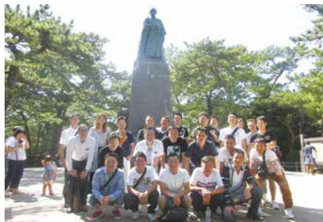
高知市内散策（坂本竜馬像の前）