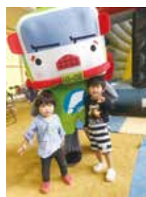
とらっくんは子ども達に大人気!!