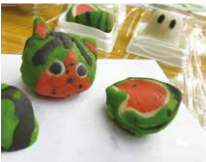
上手に和菓子が作れました。