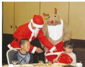
サンタからのプレゼント