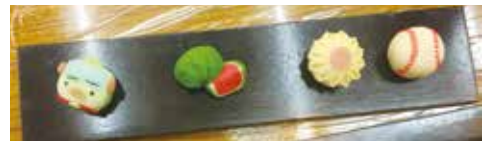
あんこで作ったとらっくん