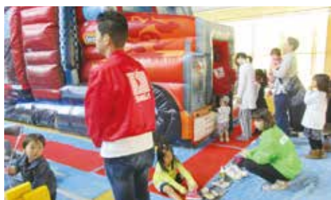
子ども広場で巨大トラックのアトラクションが大人気!!