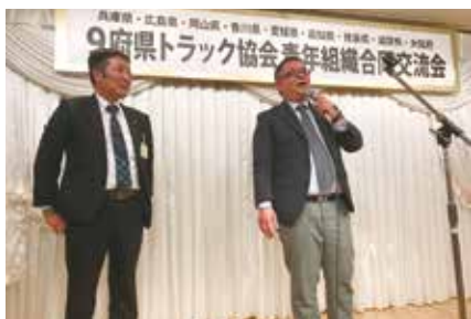
新旧会長の初参加挨拶