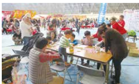
青年協ブースでとらっくんのぬりえを開催!!