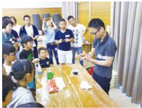
講師 鹿取氏に和菓子の作り方を 教えて頂きました。