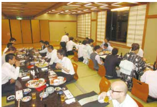
高知県トラック協会青年部会との交流会