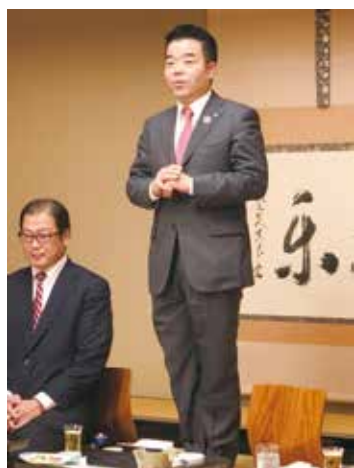
滋賀県知事 三日月大造氏の挨拶