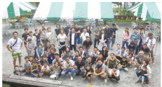
家族を交えて絆を深める事が出来ました。