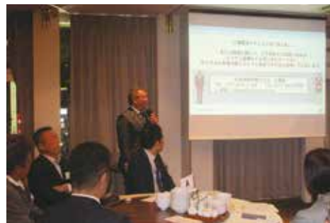
木元副会長の挨拶