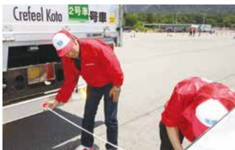
青年協メンバーが審査補助として計測