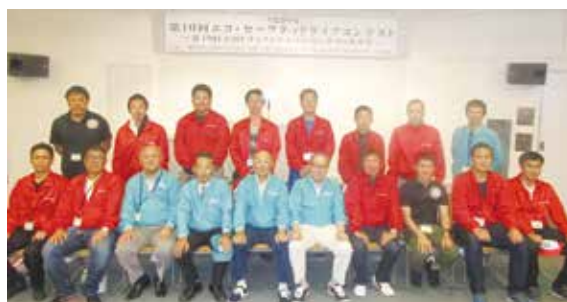
滋賀県トラック協会と青年協議会との連携