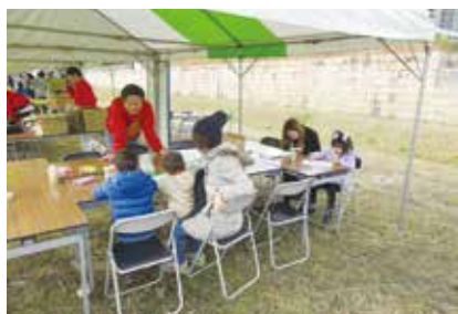
ぬりえコーナーにて