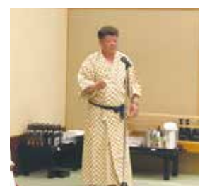
夏原氏の乾杯挨拶