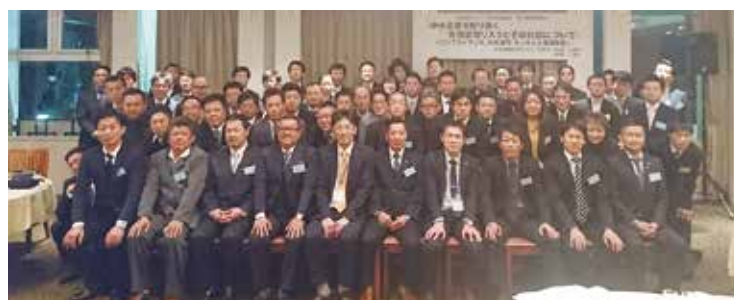
会員及びスポンサー各社様交えての交流会