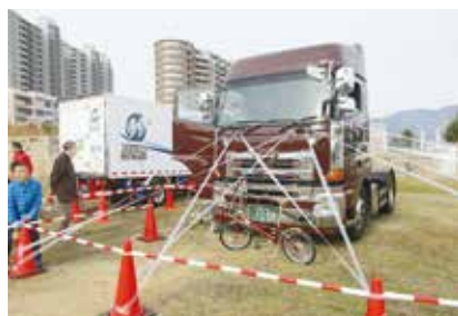
親子で大型トラックの死角を体験