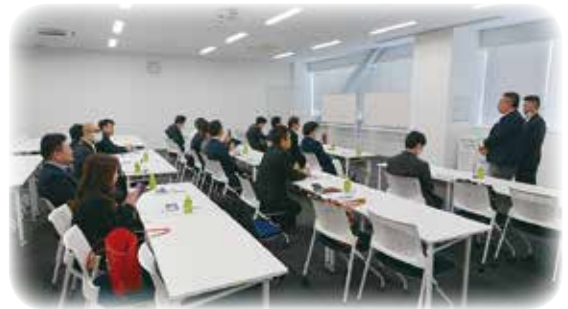
TOYOTA L&Fカスタマーズセンター内 趣旨説明