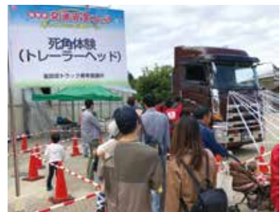
死角体験、ひんやり体験を体験中