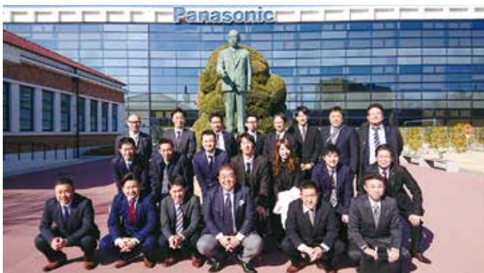
パナソニックミュージアム