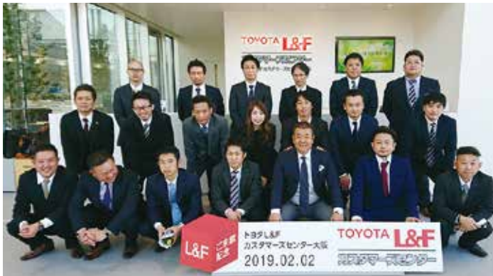
TOYOTA L&Fカスタマーズセンター大阪