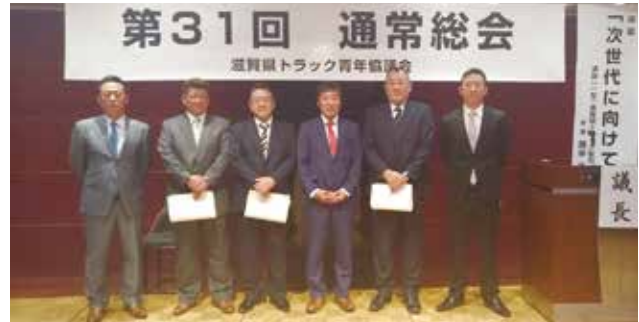
本総会において9名の会員がご卒業されました。

平成29年度事業報告及び収支報告を行い、平成30年度事業計画及び収支予算案等、すべての事業が滞りなく承認されました。