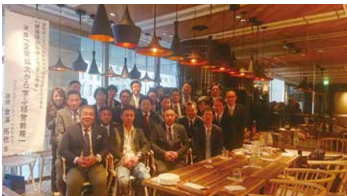
グッドスプーン淀屋橋odona