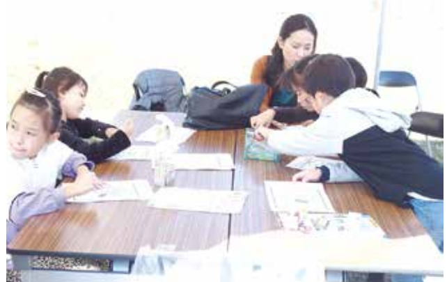
ご来場頂いた方にぬり絵をして頂きました。