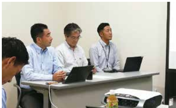
福岡倉庫株式会社の皆様