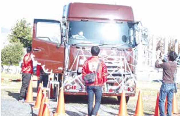
死角体験をして頂きました。