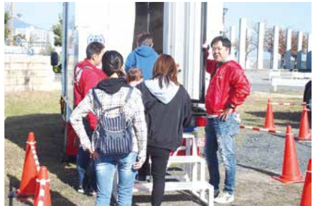
ひんやり体験をして頂きました。